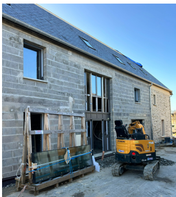
pose des ouvertures

Pour rappel, le projet est constitué d' une autre cellule commerciale de 18m 2 dont la destination n'est pas encore déterminée, de deux logements de type 4 dont un appartement situé au-dessus des locaux commerciaux et une maison à l'arrière.