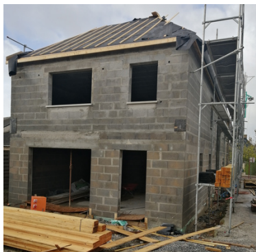
pignon de la maison