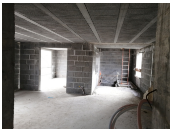
1er étage de l'appartement