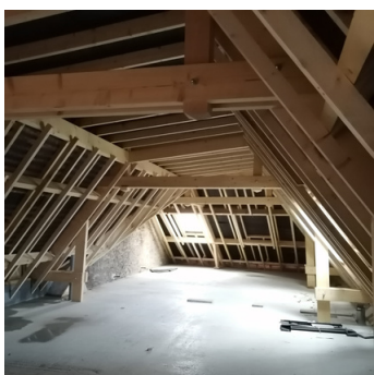
dernier étage de l'appartement